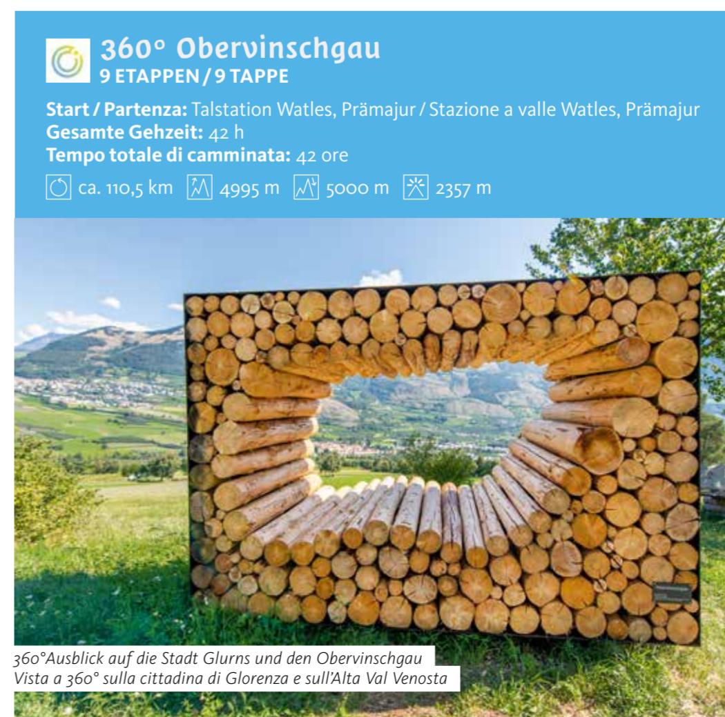
360° Ausblick auf die Stadt Glurns und den Obervinschgau Vista a 360° sulla cittadina di Glurns e sull'Alta Val Venosta